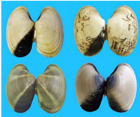
図1. アサリで観察される非対称型殻模様。